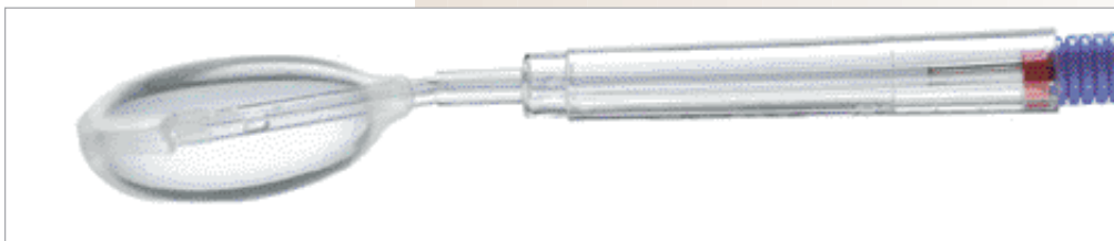
LiNA MenoTreat 6120